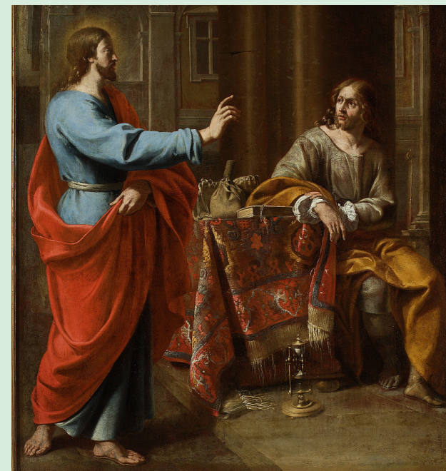
Vocação de São Mateus, Theodoor van Loon (1581/1582–1649), Museu Nacional de Varsóvia, Polónia