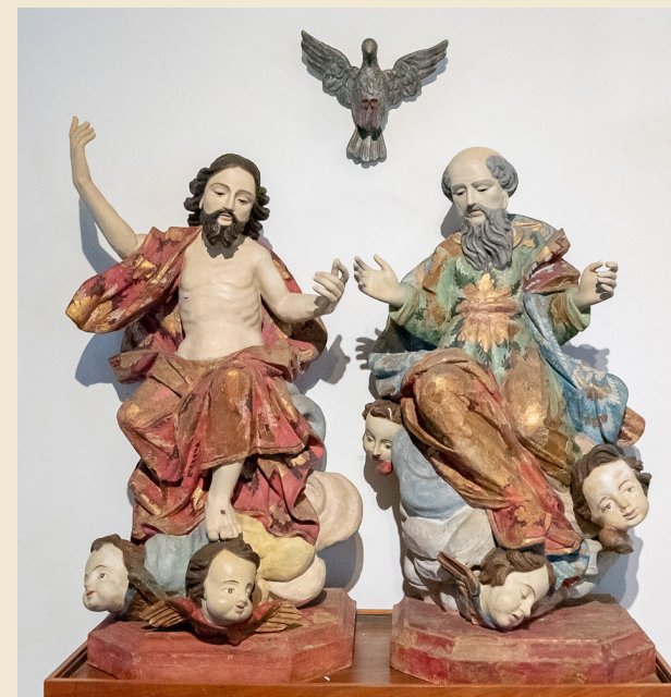
Santíssima Trindade, Escultura do XVIII, Museu de Arte Sacra da Bahia (UFBA), Salvador, Brasil