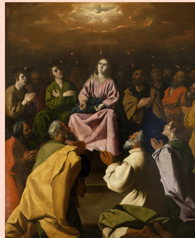
Pentecostes, Juan Bautista Maíno, 1612 - 1614, Museu do Prado, Madrid, Espanha