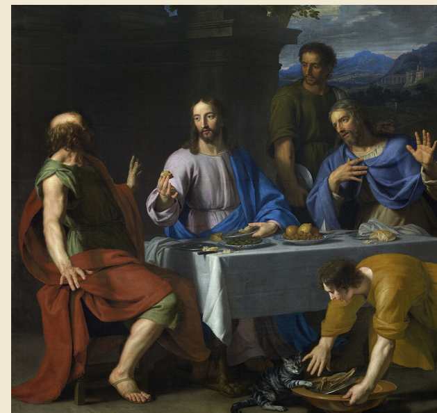
Ceia em Emaús,

Jean Baptiste de Champaigne (1631–1681), Museu de Belas Artes em Ghent, Bélgica