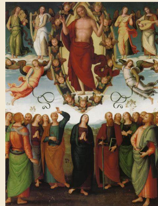
A Ascensão de Cristo, Pietro Perugino, 1505-1510, Catedral de Sansepolcro, Itália