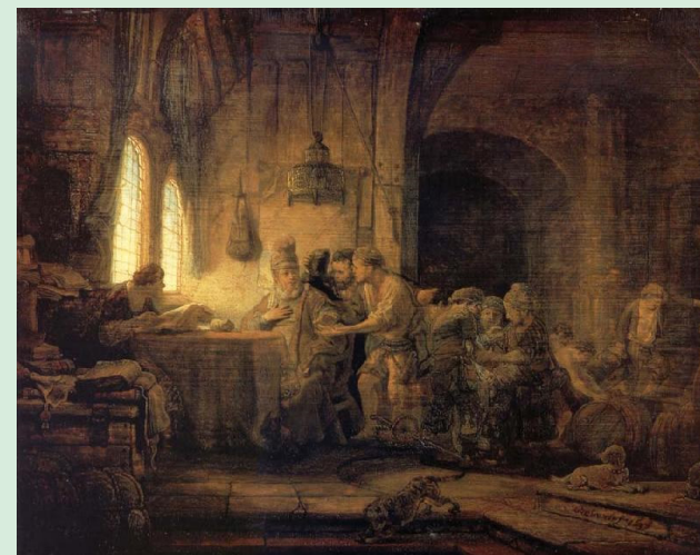
A parábola dos trabalhadores na vinha, Rembrandt Harmensz van Rijn, 1637, Museu Hermitage, São Petersburgo, Rússia