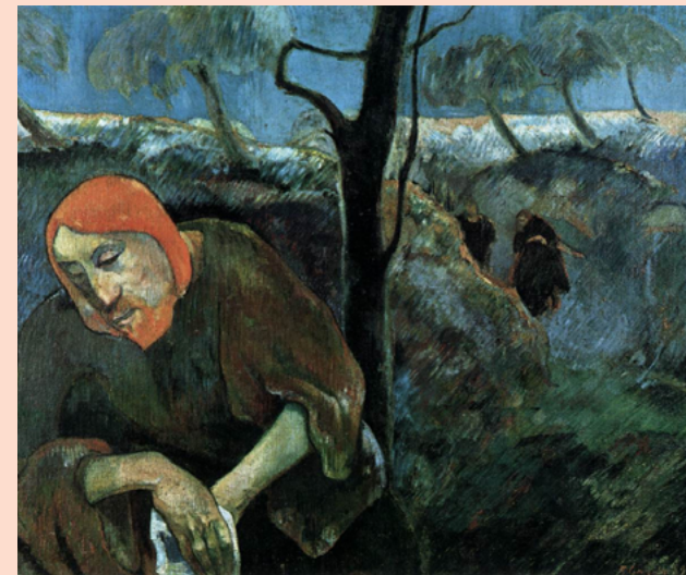
Cristo no Jardim das Oliveiras, Paul Gauguin, 1889, Norton Museum of Art, West Palm Beach, Florida, EUA