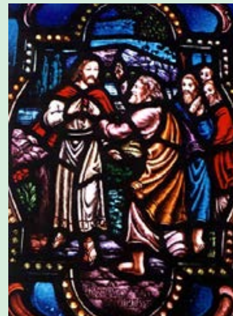
Confissão de S. Pedro, vitral da Igreja de Riverside, Nova Iorque, EUA