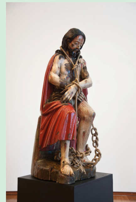
Escultura em madeira policroma do Séc. XVII – Paróquia de São João Batista – Abrantes