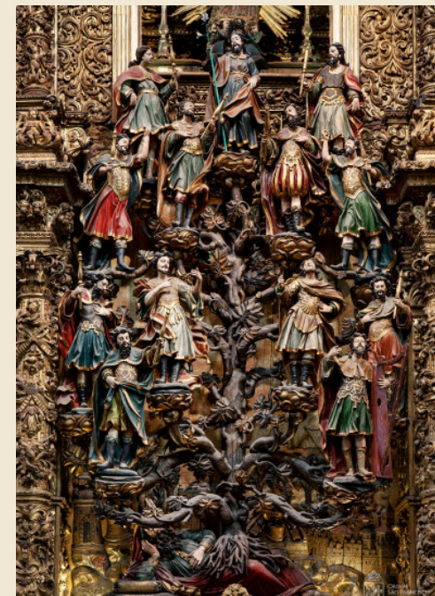
A Árvore de Jessé , de autoria de Filipe da Silva e António Gomes. na Igreja de São Francisco do Porto