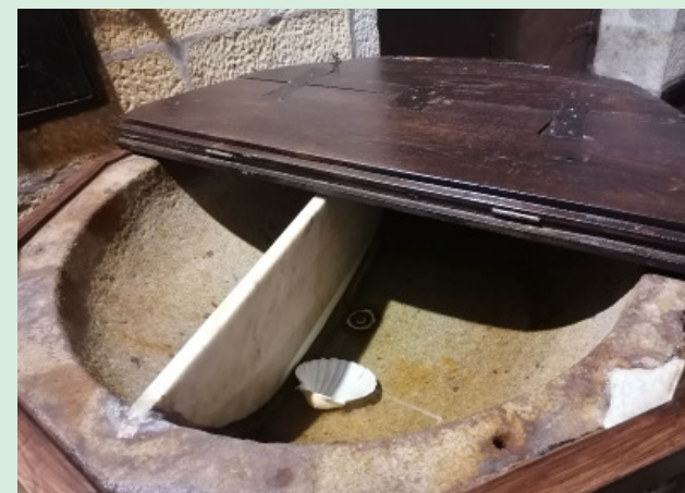
Pia Baptismal da Igreja Matriz de Vila do Conde