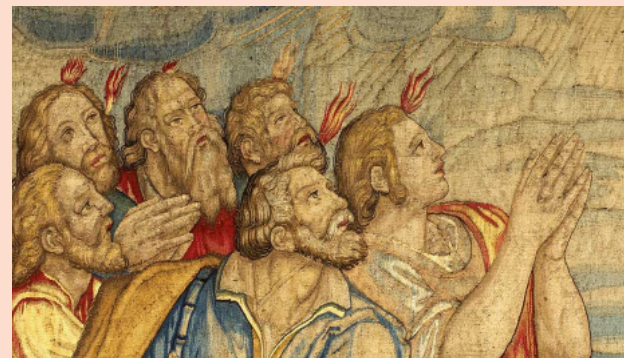
Tapeçaria multicolorida de arte italiana antiga