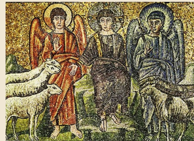
“O Bom Pastor entre dois Anjos” – Mosaico bizantino do século VI – Basílica de Santo Apolinário Novo em Ravenna, Itália