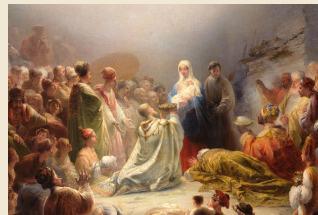
Adoração dos Magos (pormenor), 1828, Domingos Sequeira

SOLENIDADE DA EPIFANIA DO SENHOR CICLO C 06 DE JANEIRO DE 2019 ANO XL - N.º 06