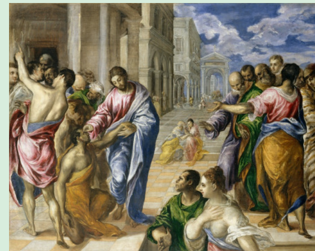
Jesus cura o surdo-mudo, El Greco, ca. 1570