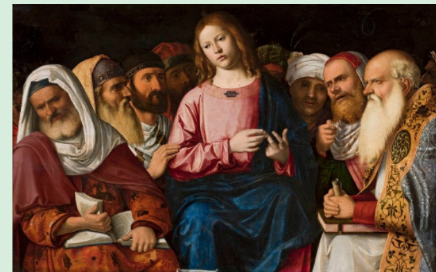
Jesus entre os doutores. Museu Nacional de Varsóvia, Polónia