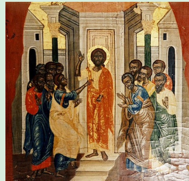
Cristo e seus Discípulos, painel de madeira pintado, Museu Copta, Cairo