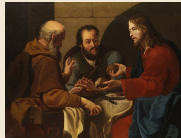
Ceia em Emaús, autor desconhecido, Itália, C. Séc. XVII